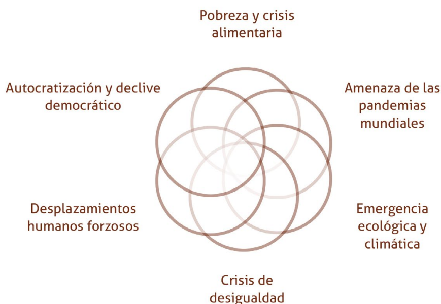
Figura 1. Crisis global poliédrica o multiforme

sociales y de salud en muchos países, con mayores efectos en las personas y los grupos más vulnerables. También ha evidenciado nuestras interdependencias como sociedad y nuestra eco-dependencia como especie. En definitiva, ha puesto sobre la mesa la necesidad de salir de la crisis con un nuevo contrato social, económico y político, que acelere las transformaciones señaladas por los acuerdos internacionales.