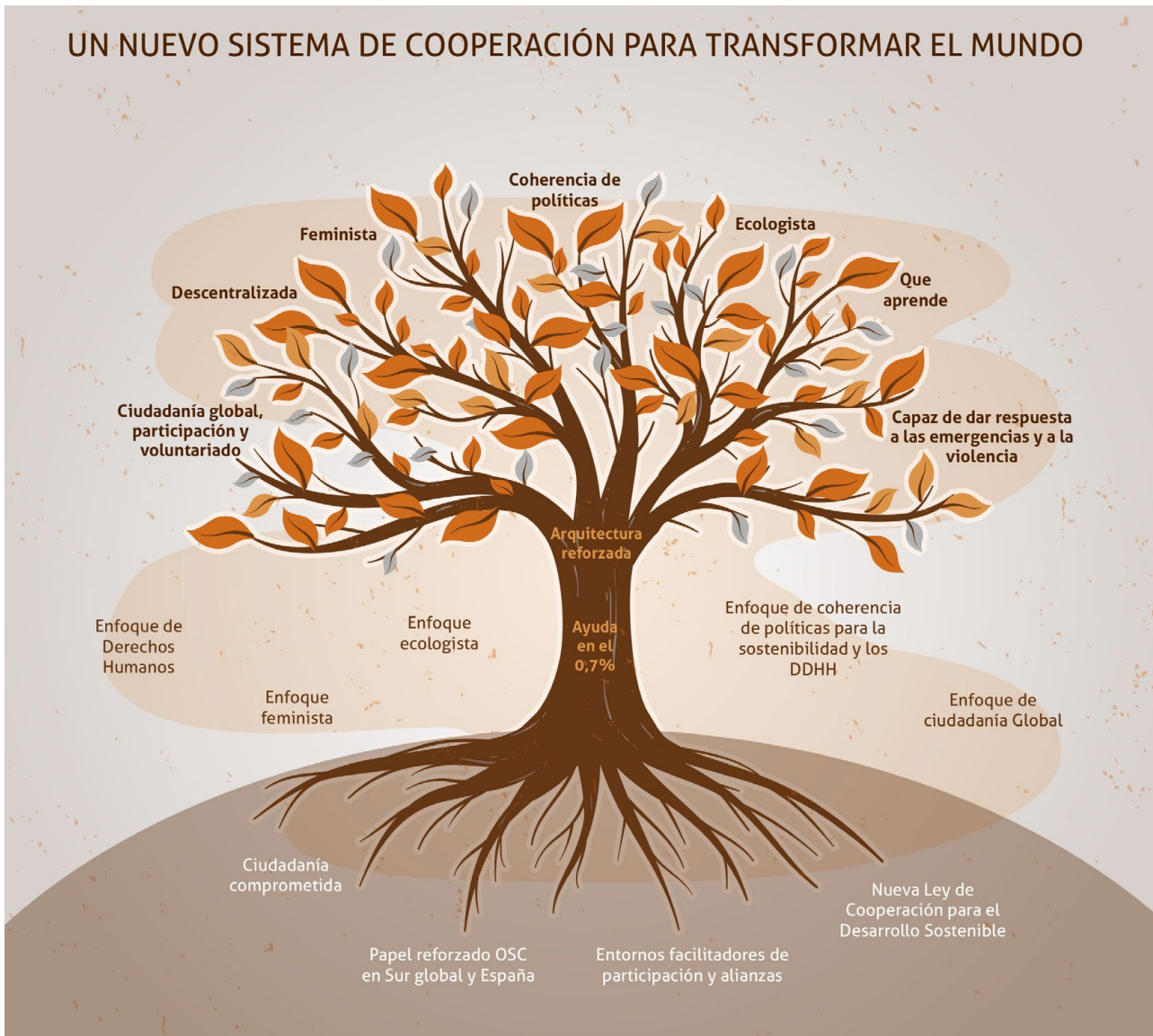
Figura 3. El árbol del nuevo sistema de cooperación