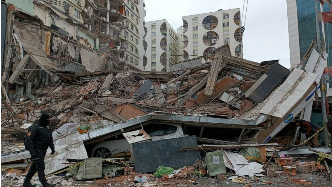
Los equipos de rescate intentan llegar a los residentes atrapados dentro de los bloques de apartamentos derrumbados en la ciudad de Diyarbakir, sureste de Turquía.